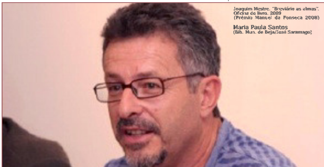
Joaquim Mestre. "Breviário as almas". Oficina do livro. 2009 (Prémio Manuel da Fonseca 2008)

e vieram umas mulheres com as ervas com que se fazem as mezinhas; depois, vieram outras mulheres com as suas benzeduras, feitiços e artes de adivinhação; mais tarde, apareceram as mulheres que lavam, vestem e cuidam dos mortos; por último, chegaram as mulheres que conhecem as palavras que se dizem quando alguém nasce e quando alguém morre; sentaram-se no chão, no largo do monte, e ficaram durante toda a noite a contar coisas que só as mulheres sabem.